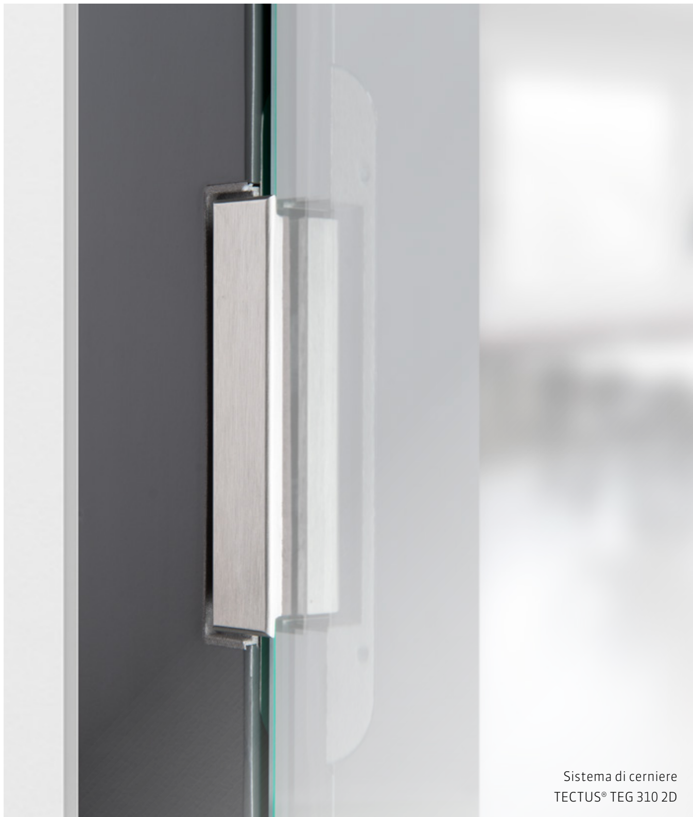
Sistema di cerniere TECTUS® TEG 310 2D