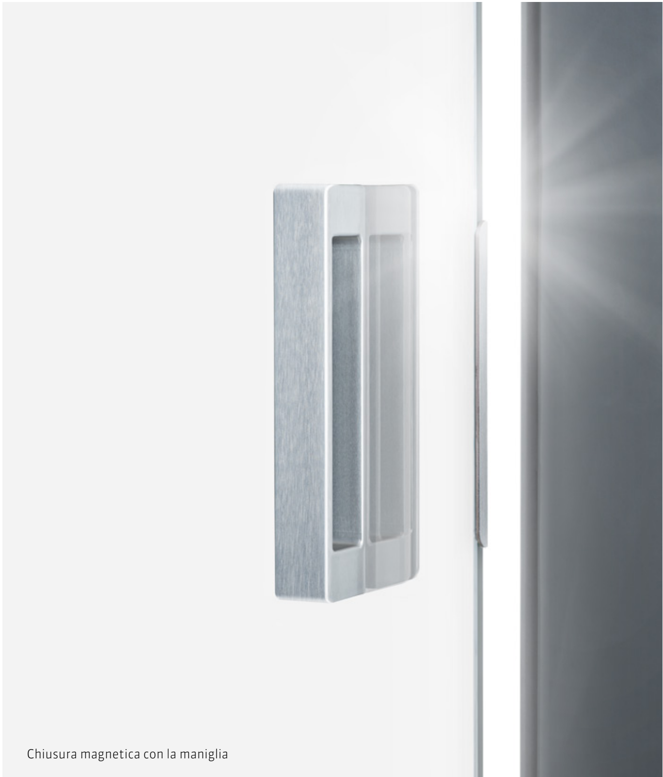
Chiusura magnetica con la maniglia